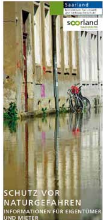
Flyer der Elementarschadens-kampagne aus dem Jahr 2015

Zusätzlich zu Maßnahmen der Bauvorsorge und Eigenvorsorge besteht die individuelle Möglichkeit, das Risiko gegen Hochwasser über entsprechende Versicherungen des Eigentums abzusichern. Eine Elementarschadensversicherung umfasst Schäden durch Hochwasser, deckt aber auch andere Risiken wie Starkregen, Erdbeben oder Schneedruck ab. Zunächst ist entscheidend, ob und wie stark Ihr Gebäude gefährdet ist. So können Sie bei Bedarf geeignete Maßnahmen zur Verminderung des Risikos einleiten. Überschwemmungen durch Flüsse und Bäche werden in Hochwassergefahrenkarten und -risikokarten dargestellt. Auf diesen Karten können Sie für Ihr Gebäude herausfinden, wie hoch das Wasser im Hochwasserfall steht. ( http://geoportal.saarland.de/portal/de/fachanwendungen/wasser.html )