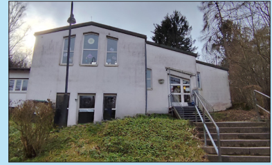
Schnappach Grădinița Mariannenthaler Straße 14b