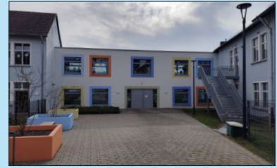
Neuweiler Grădinița municipală Pestalozzistrasse 23-25