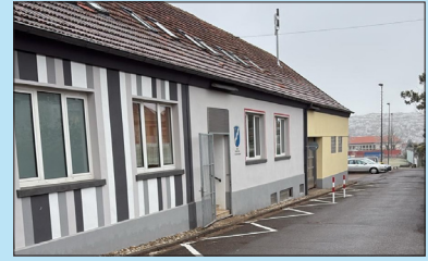
Hühnerfeld / Brefeld Depozit de construcții Schachtstraße 2