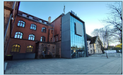
Sulzbach AULA Gärtnerstraße 12