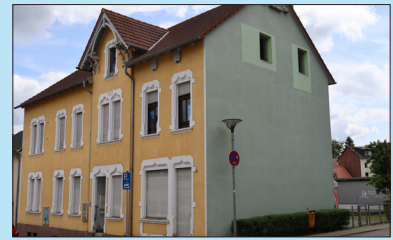
Altenwald Grubenstrasse 5