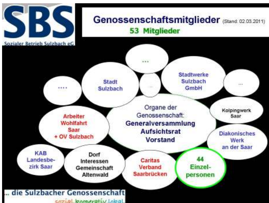
Schaubild: Mitgliederstruktur und Organe der Genossenschaft

Sowohl innerhalb der Genossenschaft als auch im externen lokalen Markt (Privathaushalte, Institutionen, Firmen) gelang es nur in wenigen Fällen kostendeckende Preise zu erzielen. Entgegen der weit verbreiteten „Geiz ist geil – Mentalität“ sagt der SBS: Gute Arbeit, gute Leistung, fairer Preis – sozial ist nicht billig. Deshalb setzt die Genossenschaft auf bewusste Kundinnen und Kunden, die Wert auf ein faires Preis-Leistungsverhält-