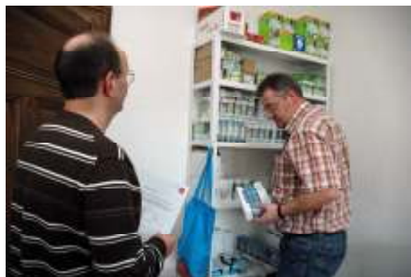
Fotos links und rechts: SBS—MitarbeiterInnen bei der Arbeit

nis und einen zusätzlichen sozialen Mehrwert durch gute Arbeit in sozialversicherungspflichtigen und tariflich entlohnten Arbeitsplätzen legen.