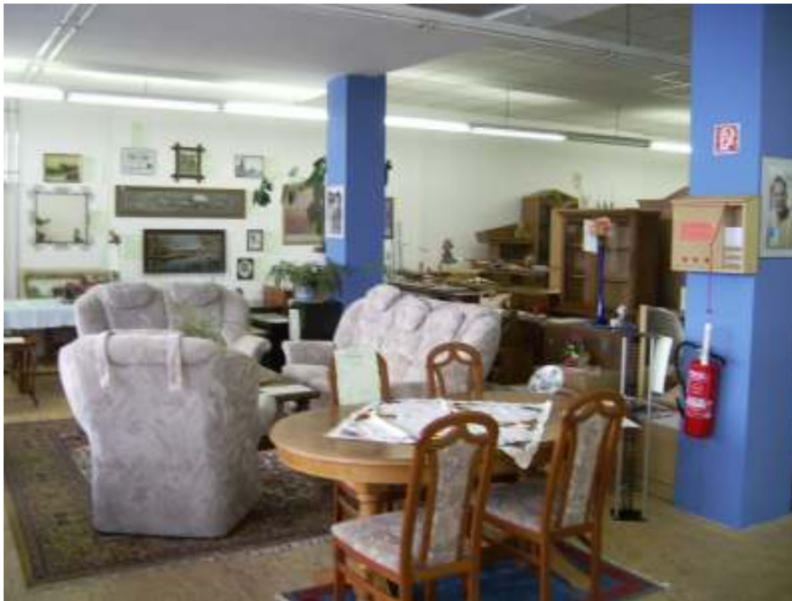
Möbelverkauf im Sozialkaufhaus Sulzbach

Wir freuen uns auf viele gemeinsame Jahre mit Ihnen.