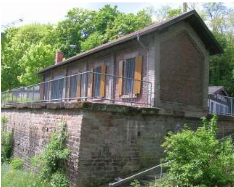
Das Ehemaliges Pfortnerhaus der Grube Altenwald wurde 2001 bis 2011 als Stadtteilbüro genutzt

Ende der 1990er Jahre wurde die Entwicklung des Stadtteils Altenwald von kommunaler Seite kritisch beurteilt.