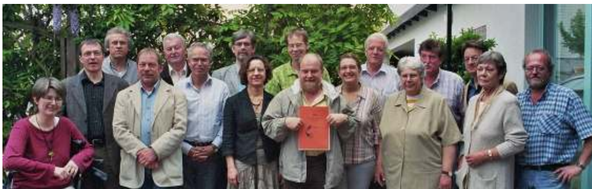
Foto: Gründungsversammlung der Sozialer Betrieb Sulzbach eG am 15. Mai 2006