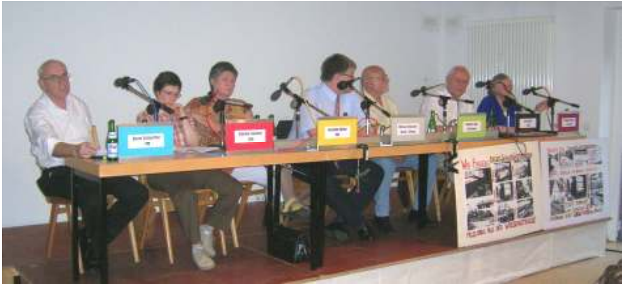
Altenwalder Dorf-Gespräch 2010

tet heute auch die Projektgruppe Dorfgeschichte, die mit dem „Altenwalder Dorfkalender“ und weiteren Veröffentlichungen wichtige Beiträge für die Identität im Stadtteil leistet.