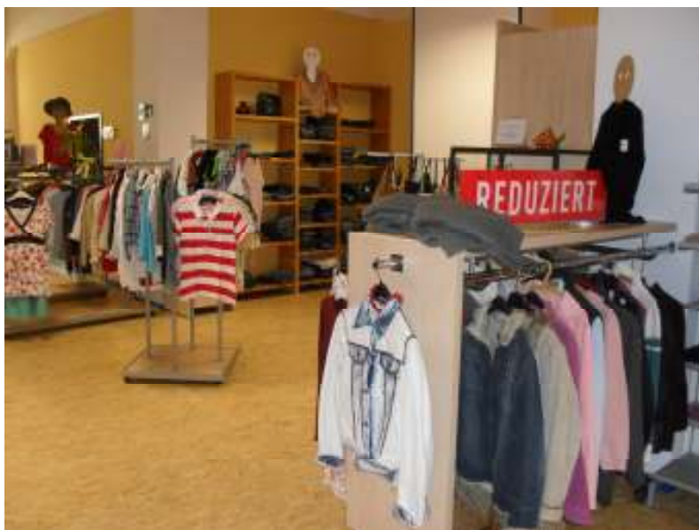
Verkaufsraum im Sozialkaufhaus

Finanziert wird das Sozialkaufhaus durch das Bundesprogramm BIWAQ (Soziale Stadt-Bildung, Wirtschaft und Arbeit im Quartier). Es trägt dabei einen wichtigen Bestandteil zur Aufwertung und Belebung der Innenstadt bei. Zum einen wurde eine seit längerer Zeit leerstehende, große Immobilie in der Sulzbachtalstraße zu einem BI-