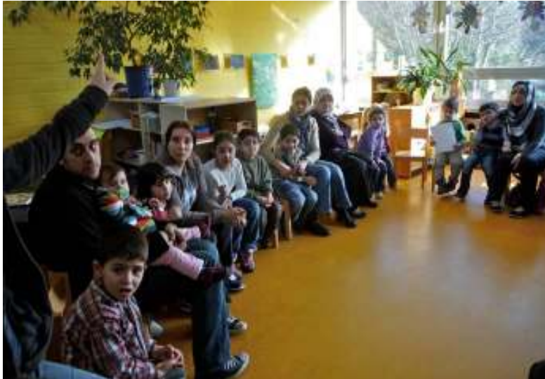
In der Eltern-Kind-Lerngruppe der Kita St. Elisabeth: Begrüßungstuhlkreis

beträgt derzeit nur 35 Plätze, ein weiterer Ausbau in Kooperation mit bereits bestehenden Einrichtungen wurde aktuell im Stadtrat beschlossen.