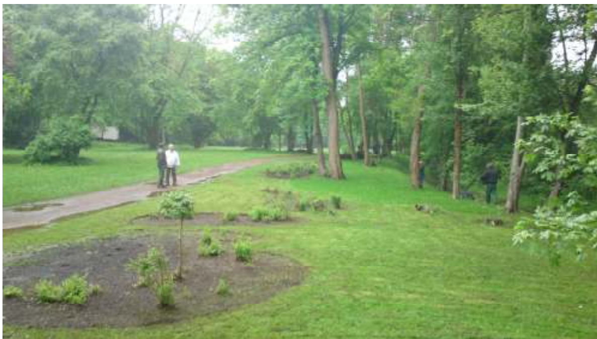
Aufnahme einer freigestellten Grünfläche im Stadtpark nach Rodungsarbeiten

Stadt“ (Bundesprogramm 2007), zur Verbesserung von Qualifikation und sozialer Situation der Bewohner und damit auch deren Perspektiven auf dem Arbeitsmarkt.