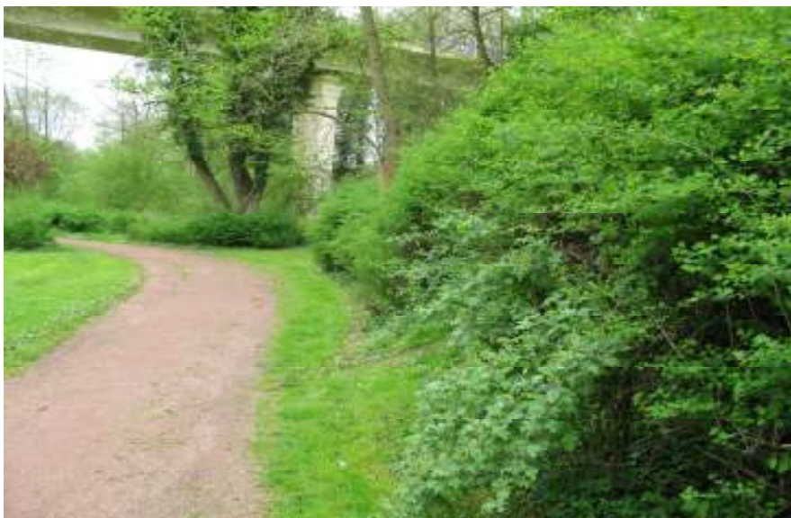
Bild einer verwilderten Fläche vor Freistellungsarbeiten

sich das Gesicht des Stadtparks umfassend verbessert wie die (vorher/nachher) Bilder beispielhaft zeigen. Viele Bürger haben sich bei uns persönlich oder den Beauftragten des Bauamtes über die Arbeiten lobend geäußert. Am 03. September 2010 fand eine öffentliche Veranstaltung im Pfarrhaus mit Vertretern der Stadt und dem Projektträger statt. Dabei erfolgte ein reger fachlicher Austausch mit der „Bürgerinitiative Stadtpark“, die mit großem Interesse unsere Arbeiten begleitet und regelmäßig positive Rückmeldungen und Anregungen zur Gestaltung des Projekts gibt.