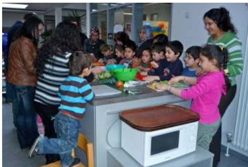
Kitas sind offen für neue Projekte: z.B. Interkulturelle Förderung im Rahmen des Signal-Projekts

Für mehr als 1/5 aller Sulzbacher Kinder werden die Elternbeiträge über die wirtschaftliche Jugendhilfe finanziert. D.h. es gibt in Sulzbach eine hohe Armutsdichte