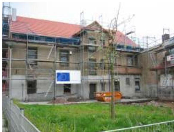
Soziale Stadt—Baustelle Grubenstr. 5

Soziale Stadt brachte neuen Schwung in den Stadtteil und Ideen was verbessert werden könnte. Mit diesem Schwung wurde 2002 die Dorfinteressengemeinschaft Altenwald e.V. als Dachverein von Altenwalder Vereinen, Verbänden sowie interessierten Einzelpersonen gegründet. Die Dorfinteressengemeinschaft setzte sich für die Interessen des Stadtteils ein und nahm in den Folgejahren viele Dinge selbst in die Hand. Jährlich wird das Altenwalder Dorffest und der Altenwalder Herbstmarkt organisiert. Das Kirmesfrühstück bereichert die traditionsreiche Altenwalder Kirmes. Mit den Altenwalder Dorfgesprächen als Diskussionsveranstaltungen zu „brennenden“ Themen im Stadtteil mischte sich die Dorfinteressengemeinschaft als eigenständiger Akteur in die Kommunalpolitik ein. Unter dem Dach der DIG arbei-