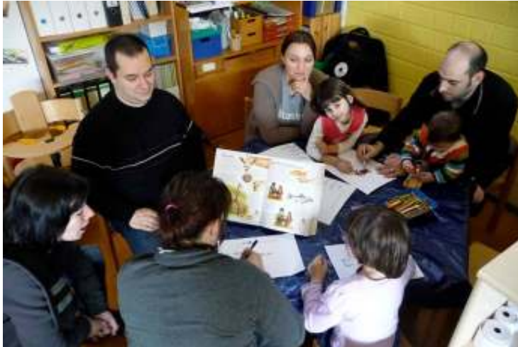
Eltern brauchen Räume um aktiv zu werden

bei Familien mit kleinen Kindern. Besonders hoch liegt dieser Anteil in Sulzbach Mitte und Schnappach: 30,7 % der Kinder der evangelischen Kita und 26,6 % der katholischen Kita und 40% des Schnappacher Kindergartens leben in einkommensarmen Haushalten. Dies korrespondiert mit den kleinräumigen Ergebnissen aus der Arbeitslosenstatistik, die zeigt dass die Sulzbachtalstraße überdurchschnittlich betroffen ist.